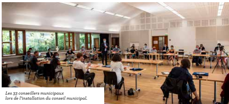
Les 33 conseillers municipaux lors de l'installation du conseil municipal.

« Pendant les six années à venir, je m'engage à avoir la même attitude que depuis 2008 : je voterai pour tout ce qui va dans le sens des intérêts des catégories populaires de la commune. Par contre, je voterai contre tout ce qui dégrade les services publics utiles à la population. Enfin, je dénoncerai les baisses de dotation de l'État à la commune. »