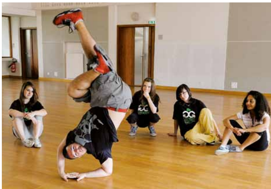
Les cours de danse Hip Hop ont lieu à l'Epi Condorcet les mercredis de 16 h 30 à 19 h.

figures de breakdance. Le chevauchement d'une demi-heure entre ces deux cours permet de travailler ensemble, de préparer des spectacles », indique Véronique Renard, directrice de l'école de musique.