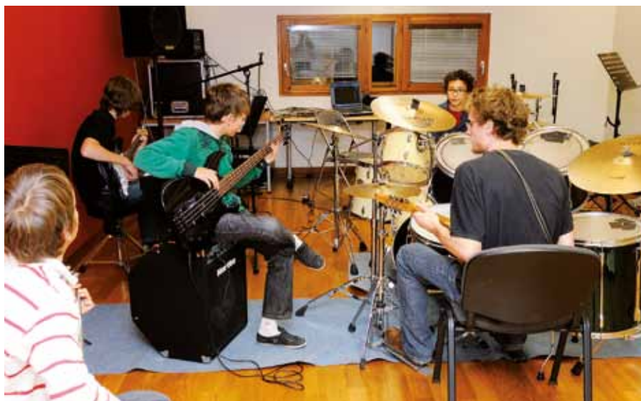
Le studio de répétition est situé au 6 ème et dernier étage de l'Epi Condorcet.

Les musiques actuelles sont un genre artistique prisé chez les jeunes. Pour répondre aux demandes des musiciens qui sont inscrits, ou pas, à l'Ecole Intercommunale de Musique et de Danse Jean Wiener, l'Epi a ouvert l'an dernier son studio de répétition.