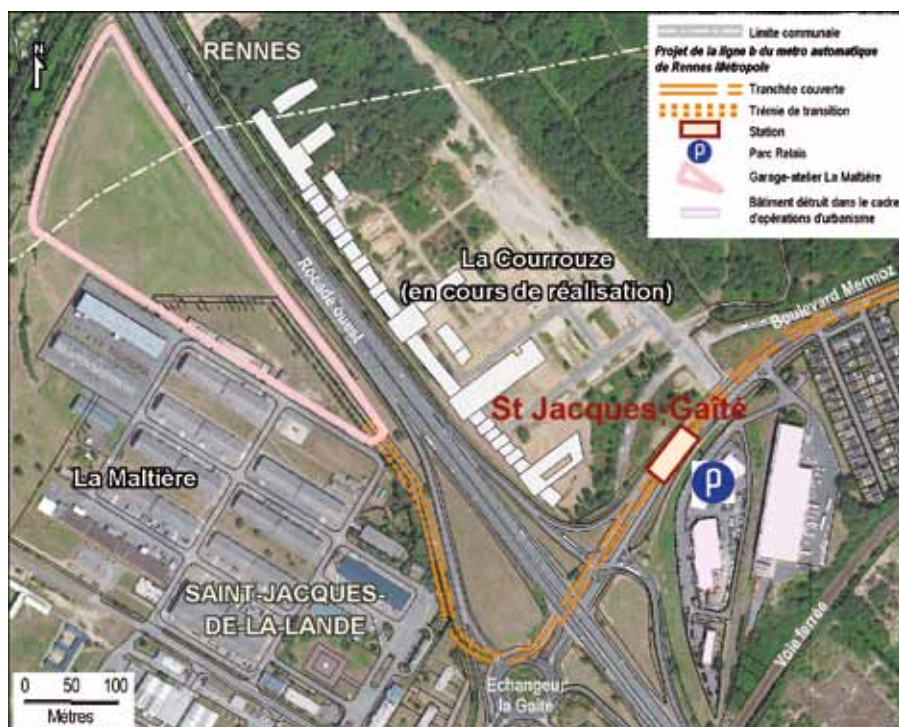
Principe d'implantation de la ligne b entre le garage-atelier et la station St-Jacques-Gaîté.

sur la ligne a, des visites (tourisme industriel, scolaires, etc.) pourront être organisées au moyen d'une course extérieure. Entre 80 et 100 emplois seront offerts sur le site.