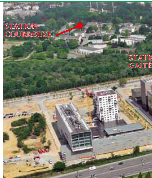
L'emplacement des futures stations situées sur Saint-Jacques-d

Elle est située à l'angle du carrefour de l'axe nord-sud du quartier, de la voie de desserte du 16 e Groupement d'Artillerie et du programme immobilier "Maisons dans les bois".