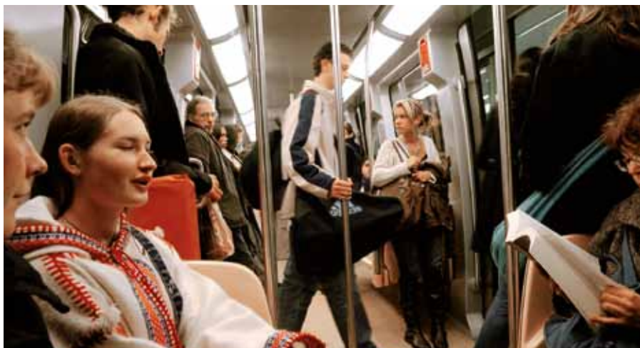
Le métro transportera 113 000 voyageurs par jour.

Les stations en surface de Saint-Jacques Gaîté, La Courrouze (et Irène Joliot-Curie) sont conçues par Laurent Gouyou-Beauchamps-Fabien Pedelaborde. Un cahier des charges d'insertion urbaine et paysagère est réalisé par l'équipe des urbanistes Secchi-Vigano-Dard-GEC ingénierie.