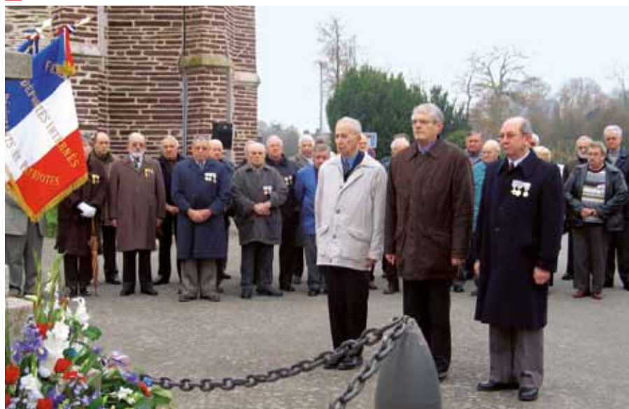
Une cérémonie commémorative à la mémoire des anciens combattants.

Les Anciens combattants veillent à transmettre la mémoire, de celles et ceux qui ont donné leur vie pour notre liberté, aux jeunes générations. A St-Jacques, les membres de l'ACPG-CATM souhaitent « utiliser leur expérience non pas comme une lanterne qui éclaire le chemin parcouru mais comme un projecteur qui éclaire le chemin de demain pour une paix plus pérenne »