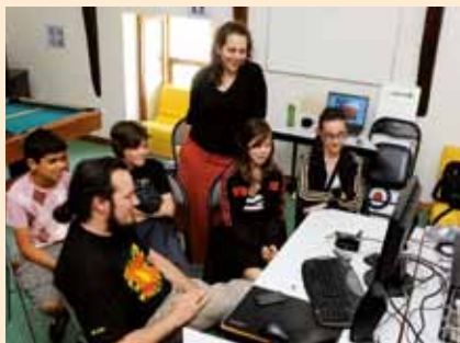
Atelier "le grand détournement" durant les vacances scolaires de Pâques à l'accueil jeunes de la Morinais avec la participation de l'association "Les pieds dans le paf".

Le Centre de la Lande propose aux jeunes un projet sur la citoyenneté et l'éducation aux médias.